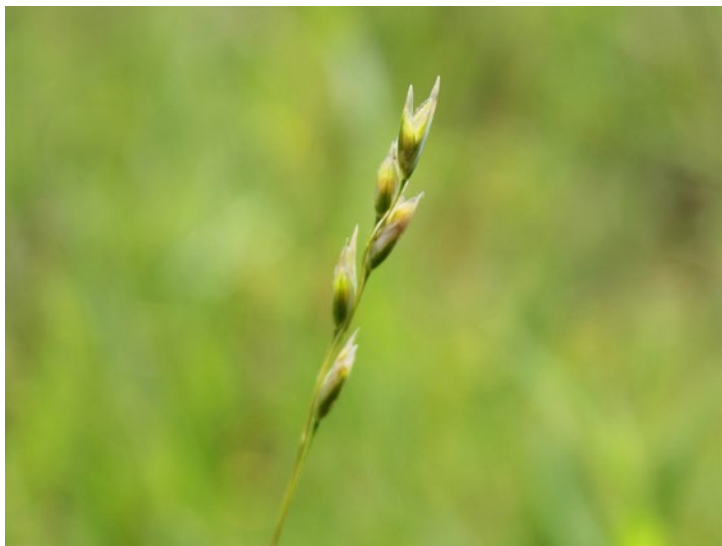
Heath-grass thrives on acidified soil. (BT)

Trizoba oklasnica uspeva na zakisanih tleh. (BT)