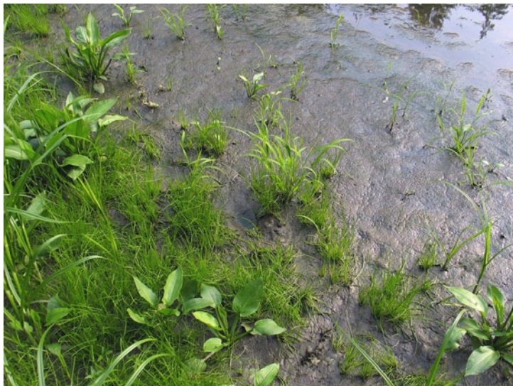
Transitional communities on temporary flooded soils. (BT)

Prehodna združba na občasno poplavljenih tleh. (BT)