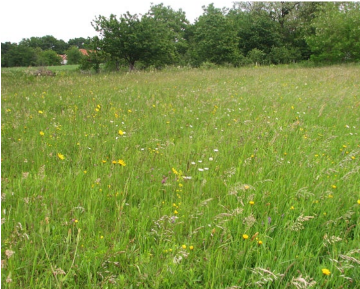
Dry grasslands are very colourful in springtime. (MP)

Suha travišča so spomladi zelo pisana. (MP)