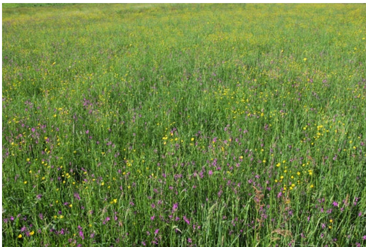
Wet hay meadows with Meadow Foxtail. (GD)

Vlažni gojeni travniki z lisičjim repom. (GD)