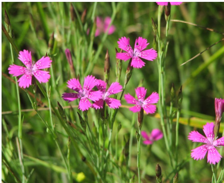
Maiden Pink (MP)