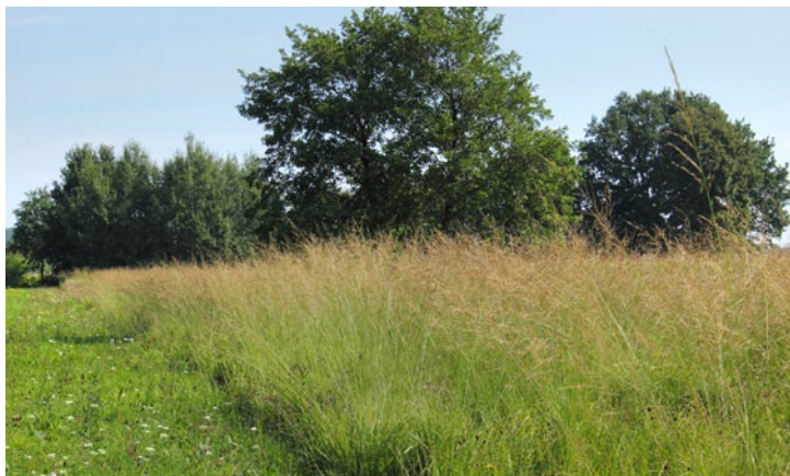
Tall Moor Grass with characteristically coloured spikelets. (BT)

Trstikasta stožka z značilno obarvanimi klaski. (BT)