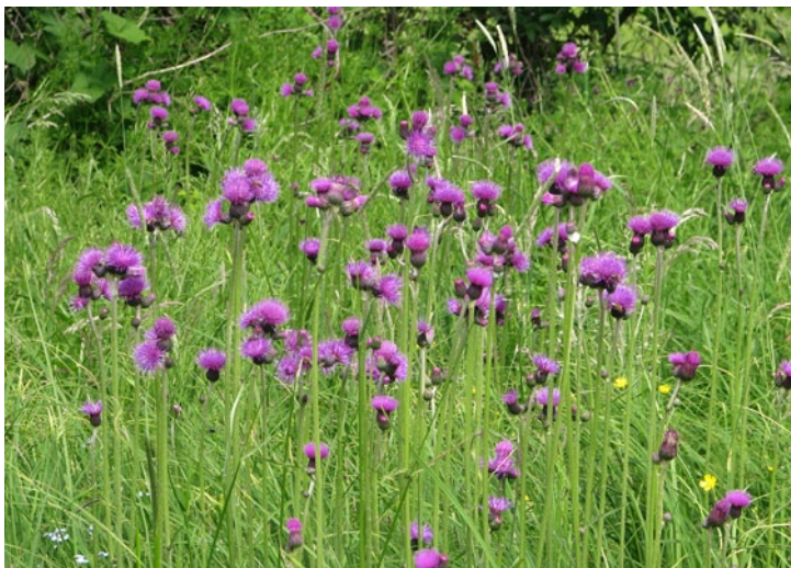
Brook Thistle (MP)