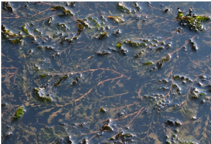
Curled Pondweed (MP)