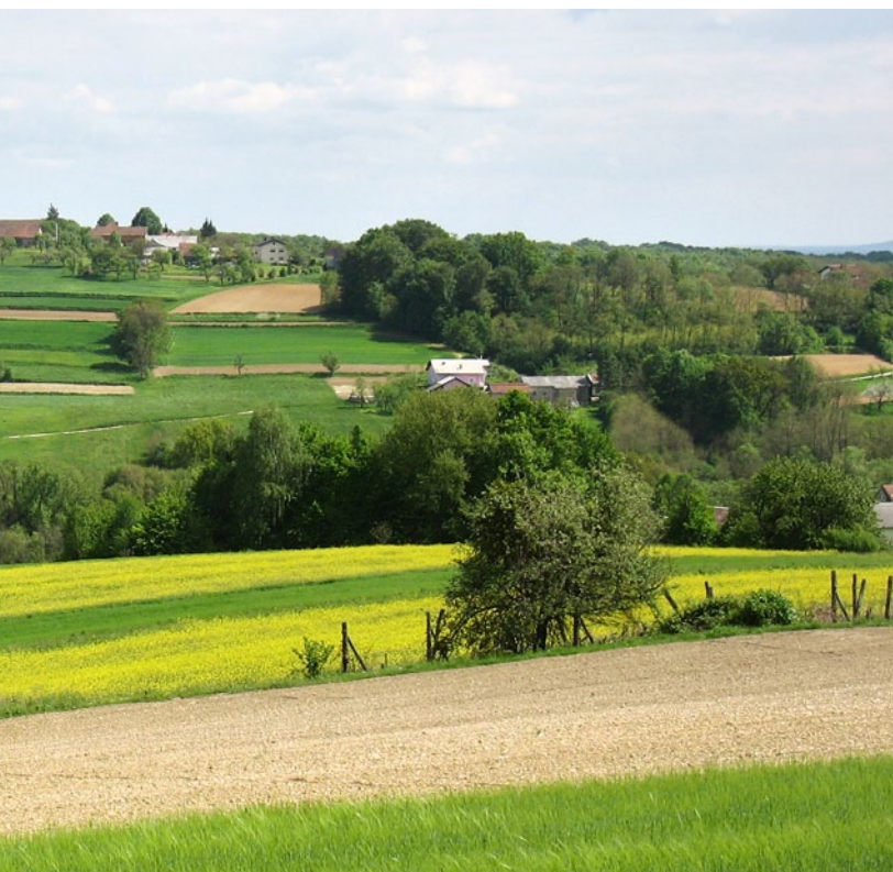
Goričko landscape (MP)

Footpaths (Site): Áfonyás tanösvény (Andovci/Orfalu), Kétvölgy-Ve-rica tanösvény (Ritkarovci/Ritkaháza), Nyugati Pont tanösvény (Sakalovci/Szakonyfalu), Zelena vez Budinci-Andovci (Andovci/Orfalu).