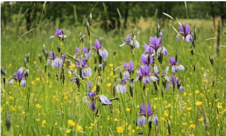
Siberian Iris (BT)