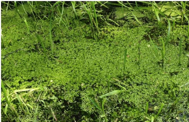
Communities of Water-starwort and Common Duckwood. (BT)

Sestoj žabjega lasu in male vodne leče. (BT)