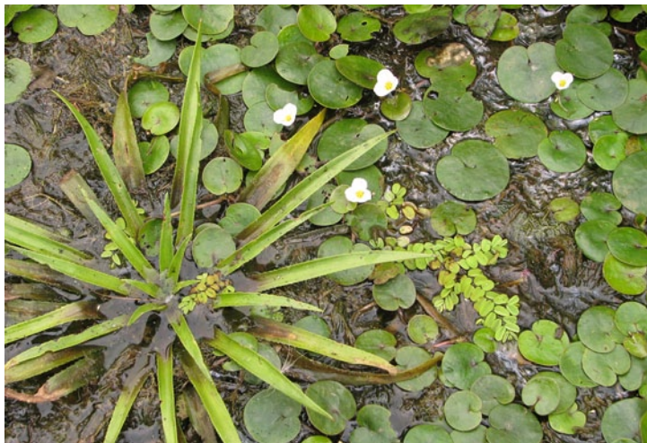
Water-soldier, Frogbit and Floating Fern in Mura oxbow lakes. (MP)

Vodna škarjica, žabji šejek in plavajoči plavček v mrtvicah ob Muri. (MP)