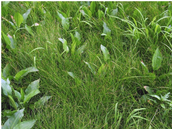
Southern Spike Rush and Common Water-plantain. (BT)

Jajčasta sita in trpotčasti porečnik. (BT)