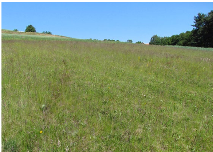
Bents give acid grasslands a characteristic hazy appearance. (MP)

Šopulje dajo kislim traviščem značilen megličast videz. (MP)