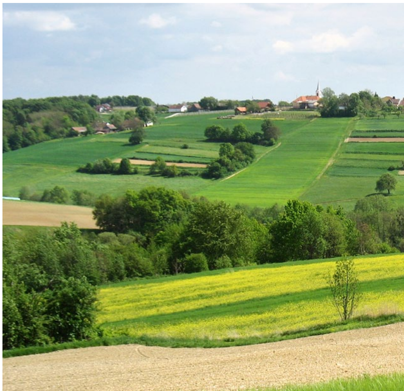
Gorička krajina (MP)

Pešpoti (območje): Áfonyás tanösvény (Andovci/Orfalu), Kétyölgy-Verica tanösvény (Ritkarovci/Ritkaháza), Nyugati Pont tanösvény (Sakalovci/Szakonyfalu), Zelena vez Budinci-Andovci (Andovci/Orfalu).