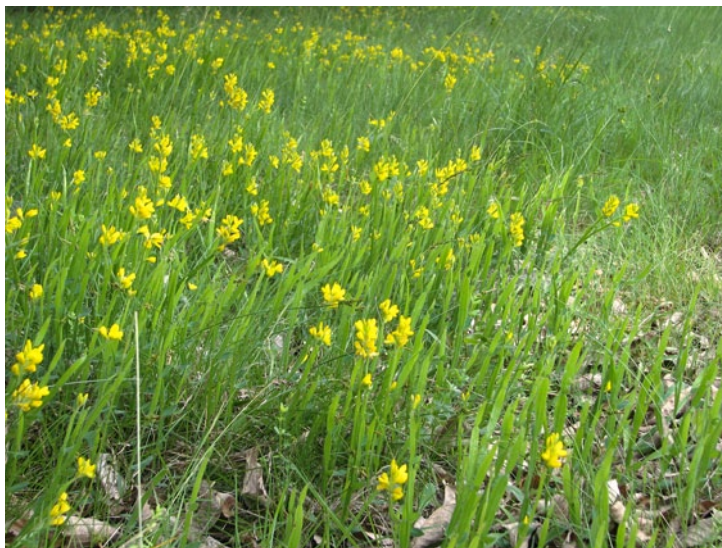
Winged greenweed (MP)