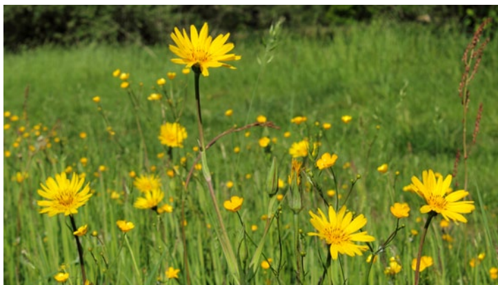
Goat's-beard in a wet hay meadows. (BT)

Kozja brada na vlažnih gojenih travnikih. (BT)