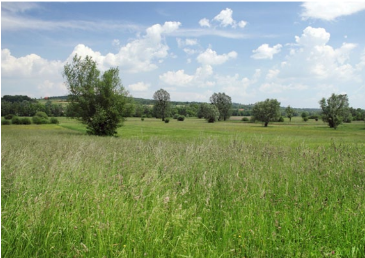
Wet hay meadows in Nuskova. (BT)