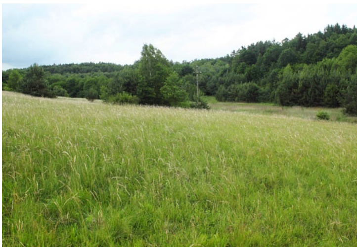
Mountain grasslands (according to the Hungarian typology), and in the distance Moor-grasses in the Andovci village. (BT)

Gorski travniki (po madžarski tipologiji) in v daljavi stožkovja v vasi Andovci. (BT)