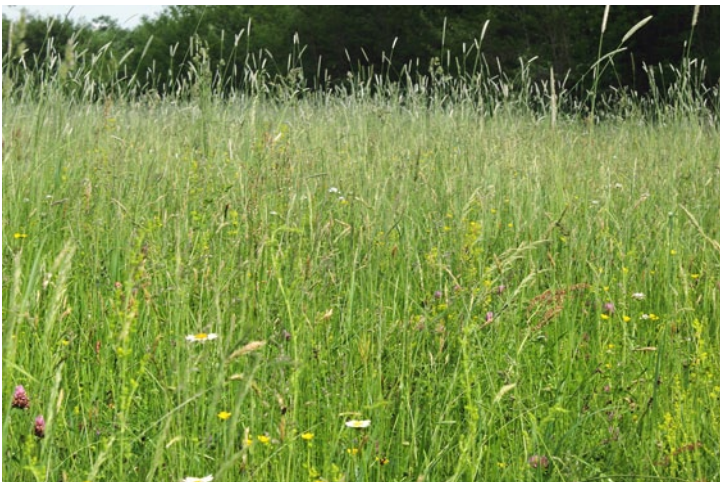
Wet hay meadows. (BT)