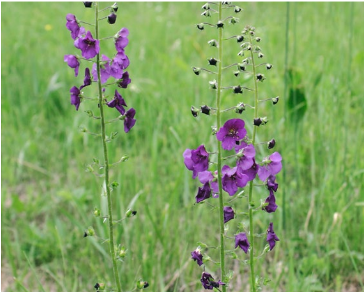
Purple Mullein (BT)