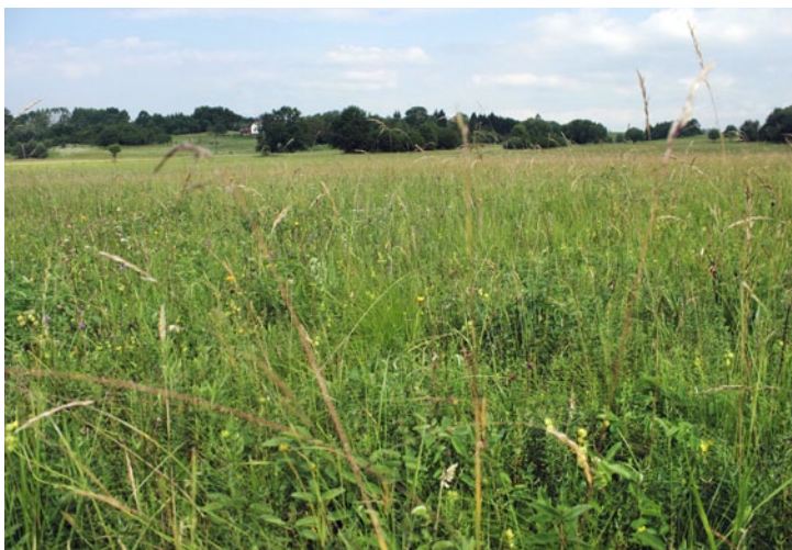
Meadows near Sola. (BT)