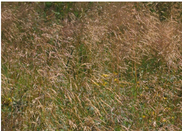
Tufted hair-grass (BT)