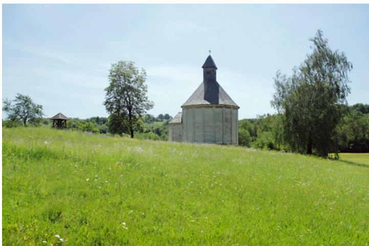
Dry meadows at the Romanesque Rotunda. (BT)

Suhi travniki pri romanski rotundi. (BT)